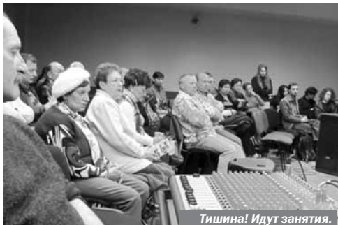
Тишина! Идут занятия.

7.11.2010 г. всемирно известный еврейский учёный и учитель раввин Адин Штейнзальц завершил свой монументальный труд — перевод Вавилонского Талмуда и написания комментария к нему — труд, на который потребовалось 45 лет работы и результатом которого стали 45 томов Великой Книги. Именно поэтому этот день был объявлен Всемирным Днём Еврейского Знаний.