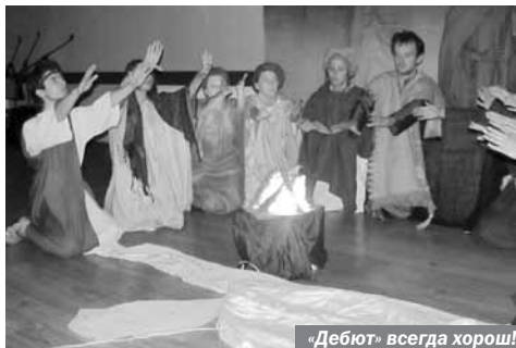
«Дебют» — всегда хорошо!