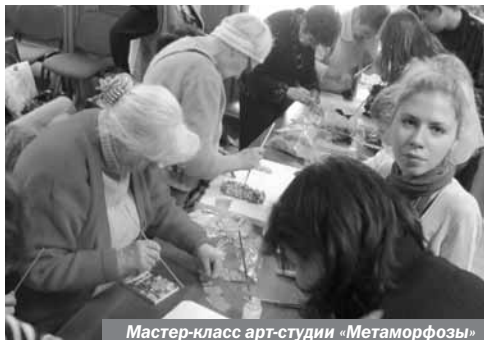
Мастер-класс арт-студии «Метаморфозы»

В 2011 г., следуя призыву раввина Адина Штейнзальца — «Научи народ мой» — ВДЕЗ был посвящён изучению молитвы «Шма Исраэль» в свете высказываний мудрецов Талмуда. 13 ноября 2011 г. у всех еврейских общин мира появилась уникальная возможность собраться вместе для изучения еврейского наследия и культуры, почувствовать себя одной семьёй. Идея ВДЕЗ — напоминание нам о том, что в какой бы точке земного шара мы не жили, всех нас объединяют наши святые книги и еврейские ценности.