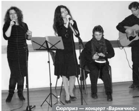
Сюрприз — концерт «Варничек»

Программа проведения ВДЕЗ была довольно насыщенной: образовательная-познавательная. Первой, конечно же, была образовательная часть, состоявшая из лекции, посвящённой изучению молитвы «Шма, Исраэль» — символа