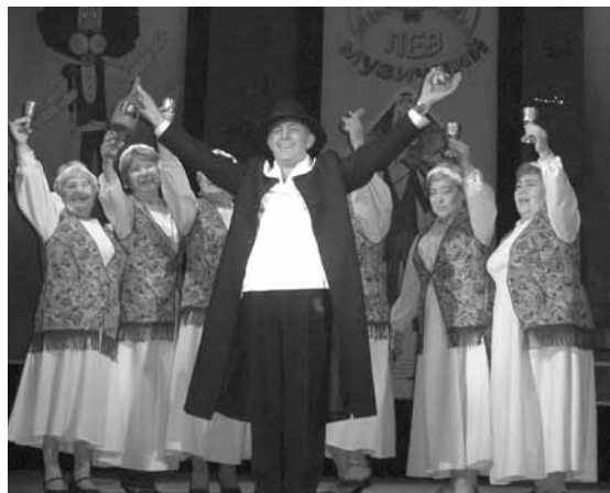
Мазл Тов, Казань!

Заметки с Первого международного фестиваля еврейской музыки, песни и танца «Музыкальный Лев». Львов, 4-6 ноября 2007