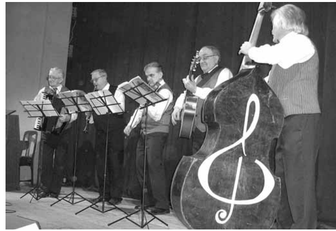
Клезмерский оркестр. Львов